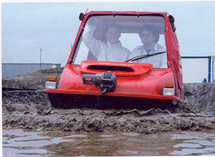
Obojživelná šestikolka Havel budila pozornost