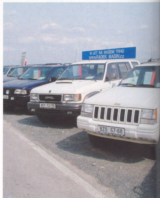
V areálu byl i autobazar terénních vozů

Účast vystavovatelů byla slabší než vloni, dovozci, zastoupení prodejci terénních automobilů ničím nepřekvapili. V jejich stáncích chyběla nabídka doplňků a příslušenství a kromě BMW X3 prakticky nic nepředstavili. Nápaditější byla expozice firmy AutoMax, zabývající se dovozem a úpravami vozů Aro a Honker pro provoz v ČR. Své vozy představila nejen v hale, ale také na terénním polygonu, kde se pokoušely zvládnout zá- lud-