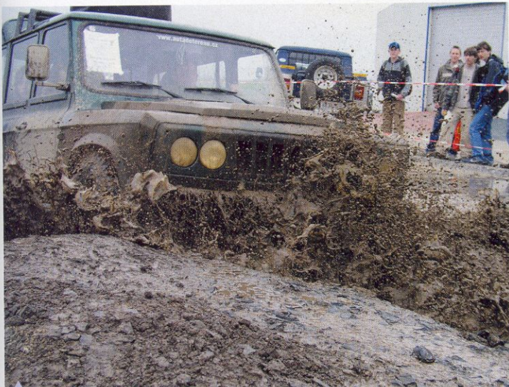
V takovém terénu se cítí ARO jako doma