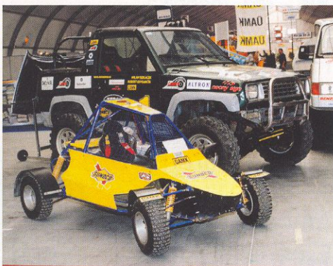
Nejen junior buggy, ale také speciální čtyřkolky jsou dnes dětem k dispozici