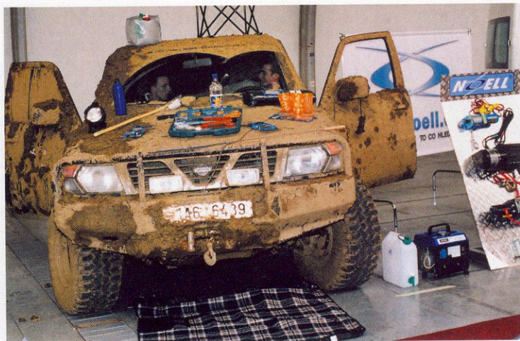
Když offroad, tak pořádně špinavý