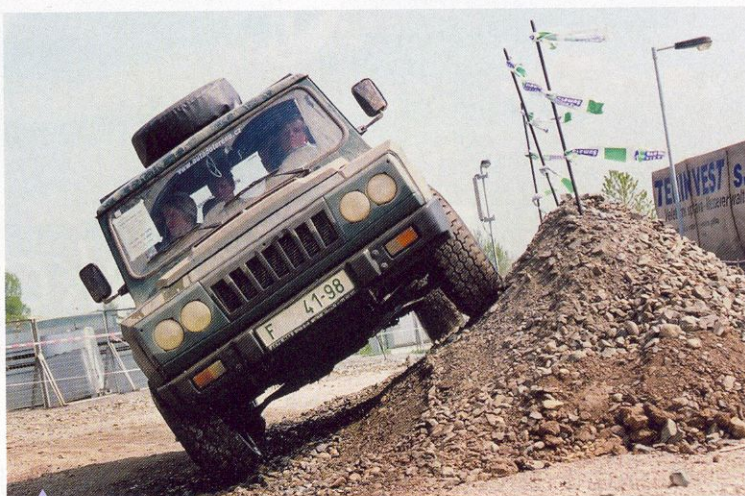
Na terénní dráze nechyběl ani atraktivní boční náklon

nosti tratě společně s vozy BMW X3 a X5. Ve volných chvílích se tam proháněla ještě neprodávaná šestikolka Havel. Hummer centrum mělo na stánku našeho časopisu vedle krásných dívek model H2, oproti nablýskaným exponátům, naaranžovaný s bahenním přelivem. Spolu s expedičním Discovery, maratonským speciálem a čtyřkolkou tvořil i s projekční obrazovkou pěkné zákoutí opravdovým offroadákům. Nechyběla plzeňská firma Dajbich s upravenými modely