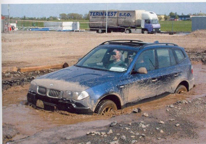
V uměle vytvořeném brodu dokazoval své schopnosti BMW X3