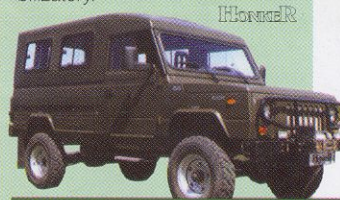
HONKER hard top 2 + 7 míst 659 000 Kč

Velice přizpůsobivý podvozek tradiční ruské značky UAZ je schopen zajistit dostatečný komfort i na silnici. Ve standardní výbavě nechybí posilovač řízení, perfektní odhlučnění, tuhé obě nápravy jsou vybaveny dvojitými hydraulickými tlumiči pérování a stabilizátory.