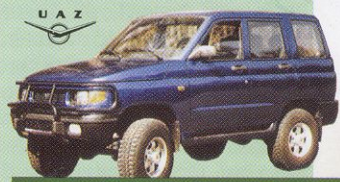
UAZ 3160 TD od 450 000 Kč

ARO zahrnuje 16 modelů ve třech typových řadách.