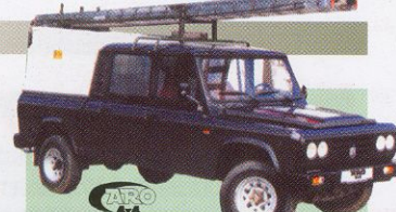
ARO 324 s nástavbou 5 míst 446 000 Kč