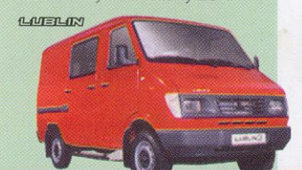
Lublin 3 podle typu od 399 000 Kč

Originální vůz s působivým vzhledem je přepracované provedení armádního vozu s 2 typovými řadami. Lublin kromě příznivé pořizovací ceny má i ceny náhradních dílů na úrovni vozů Škoda 120. Jeho předchůdcem byl nezníčitelný ŽUK.