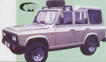
ARO 246 safari 5+(2) míst 406 000 Kč

Osazované jednokotoučové, suché a mechanicky ovladatelné spojky jsou značky VALEO. Mechanická převodovka (5+1) EATON-TCZEW je doplněna redukcí mechanickou převodovkou (2 převody, 4 polohy) a vozy mají symetrický zadní diferenciál, na přání uzavíratelný.