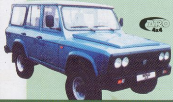
ARO 244 sport 5 míst 399 000 Kč

Přední náprava je nezávisle zavěšená s volitelným ovládním předního pohonu, vinutými pružinami a teleskopickými tlumiči. Zadní tuhá a trvale poháněná náprava má listové pružiny a teleskopické tlumiče.