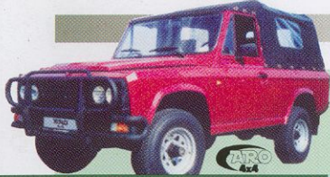
ARO 240 klasik 2+(6) míst 369 000 Kč

Osazované polské čtyřválcové dieslové motory Andoria s nepřímým střikem paliva (Bosh) mají objem 2 417 cm 3 a výkon 66/75 kW. Otáčky motoru při max. výkonu jsou 4 100 ot./min a při max. toč. momentu 2 500 ot./min. (max. toč. moment je 195/225 Nm).